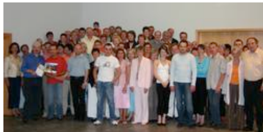
Les membres d'Arco 16 et leurs invités de Neumarkt St Veit.

Durant le week-end, l'association des artisans et commerçants du pays de Wissembourg Arco 16 a eu le plaisir d'accueillir ses homologues bavarois de Neumarkt-Sant Veit, ville à l'est de Munich que les Alsaciens avaient visitée en avril 2005.